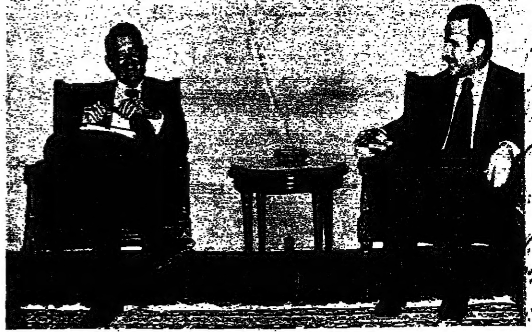
الرئيس الأسد ووزير الخارجية السوري فانس قبل بدء المباحثات